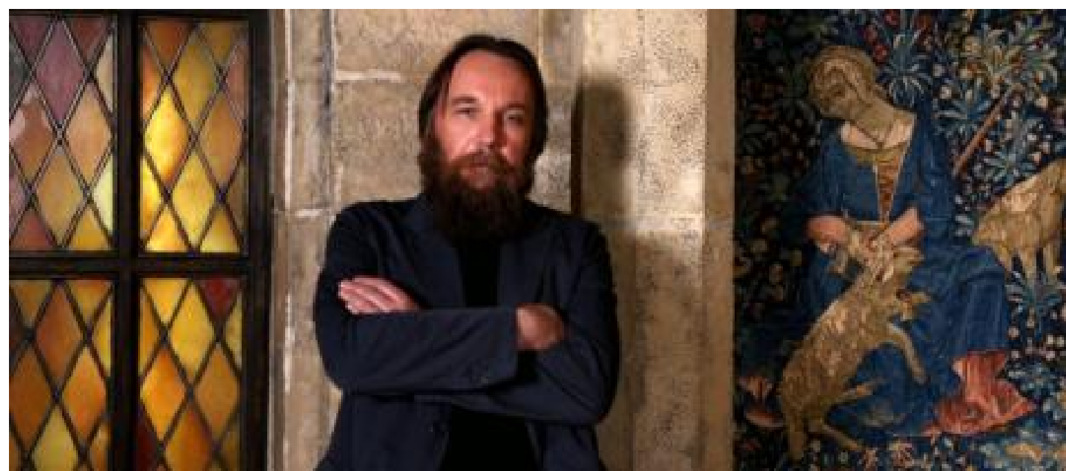
Lo stop ad Aleksandr Dugin, la sinistra e il vizio della ... - nicolaporro.it

In questi giorni il noto e discusso intellettuale era in tour in Italia.